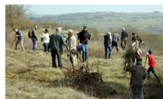
Une belle activité régénère sur les hauteurs du Bollenberg, ce samedi 7 mars au matin.

Dans le cadre de l'animation Natura 2000 collines sous-vosgiennes, deux chantiers nature ont été menés à bien. Le premier a réuni une quarantaine de personnes le 21 février. Soixante-dix volontaires de tous les âges ont pris part au second, ce samedi, au Bollenberg à Orschwihr.