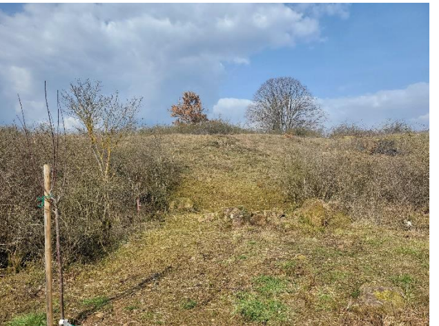
Compte-rendu du chantier nature du 07/03/2026 sur le Bollenberg